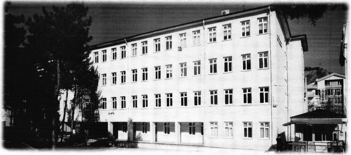
Fakültemiz Hizmet Binasından Bir Kesit.